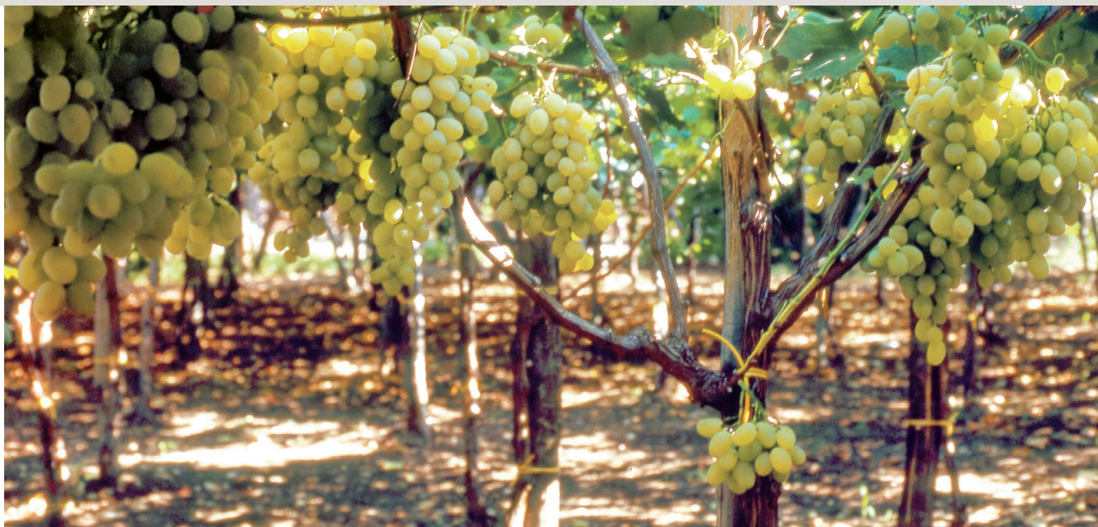
Tendone di Regina in Puglia